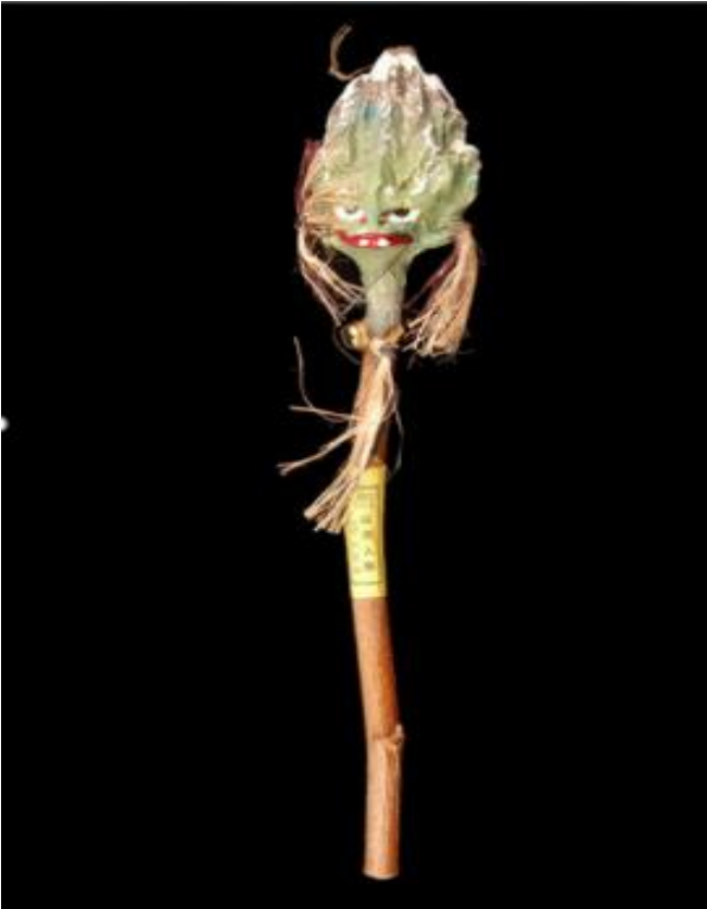
Tête de génie de la montagne Yamabiko Terre cuite peinte, fibres, métal (grelot), bois (manche) Milieu du XX e siècle 29,5 x 5 x 4,5 cm Musée du quai Branly - Jacques Chirac, Paris

Document n° 1 : Ressources iconographiques qui seront mobilisées, pour tout ou partie, dans la composition et/ou le déroulé de la séance.