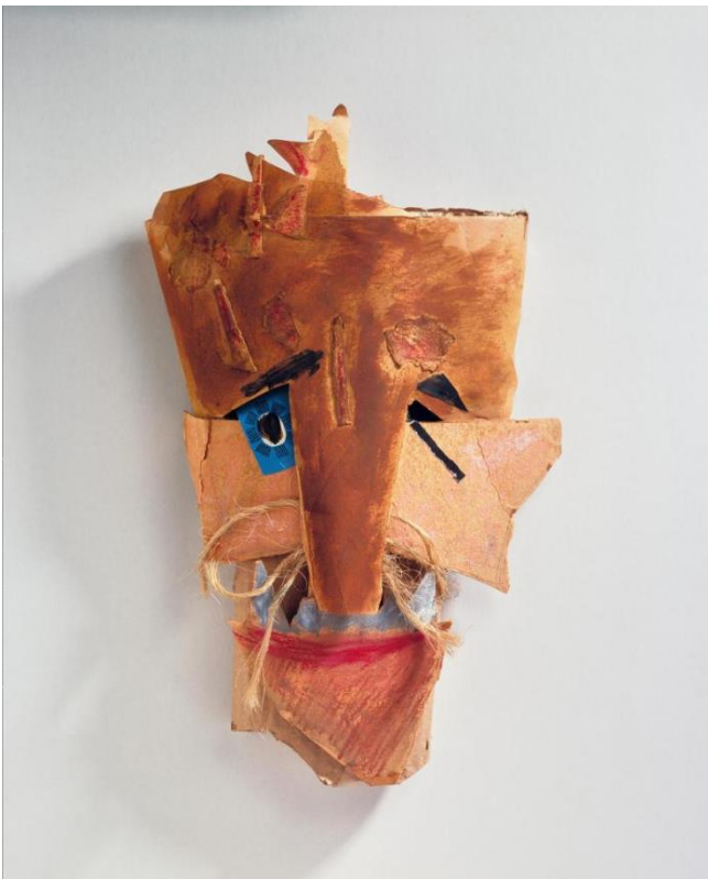
Marcel Janco, Masque , 1919, Papiers collés, carton, ficelle, retouches gouache et pastel, 45 x 22 x 5 cm, Centre Pompidou, Paris